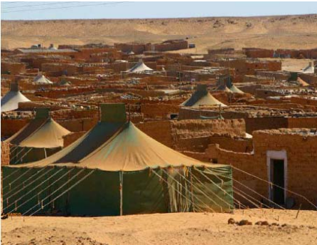
Vista del campo de refugiados