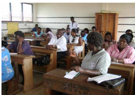
Profesores en cursillo de capacitación.