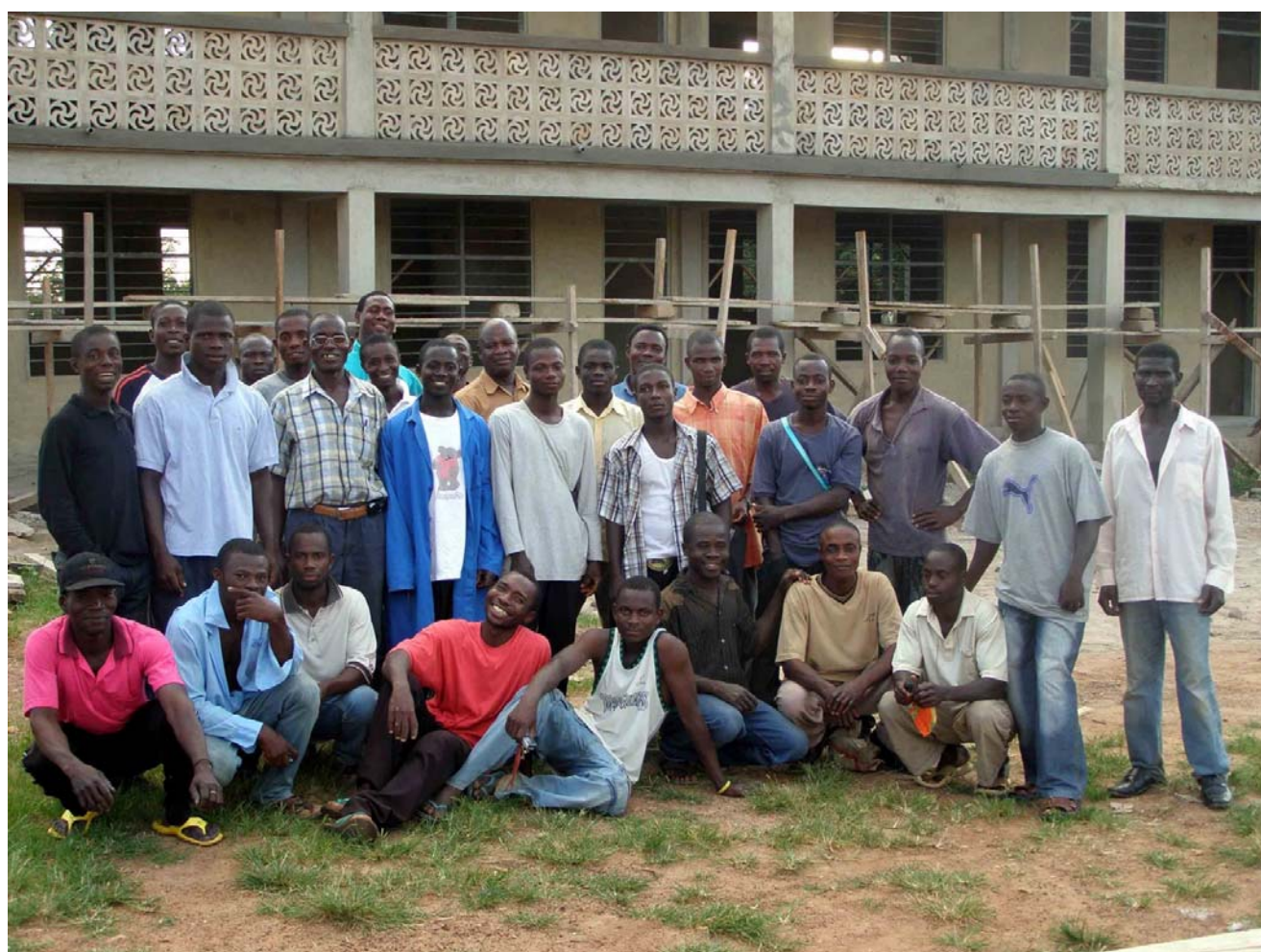
Trabajadores del proyecto Derribo y Reconstrucción de las Escuelas de St. James y St. Patrick. Sunyani, Ghana.