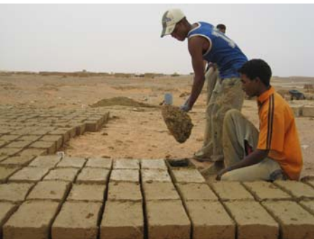
Elaboración bloques construcción