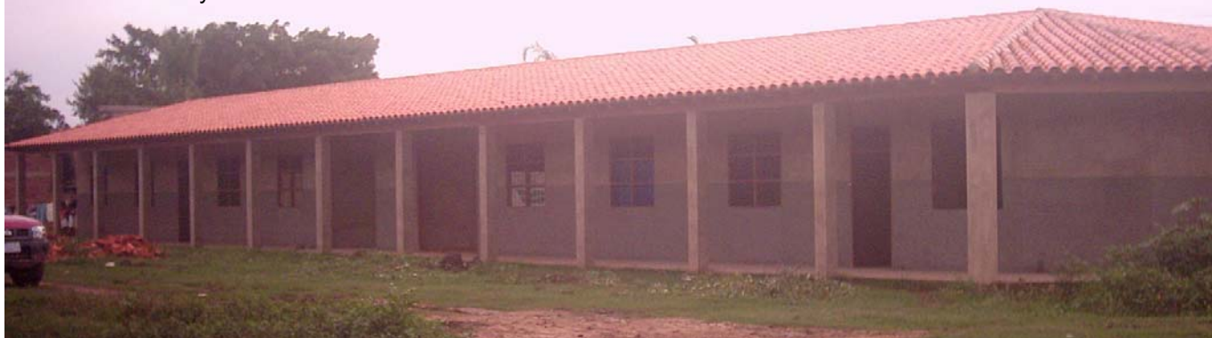
Estado Sede Timi y Tim al finalizar Fase I

A su vez, el proyecto contempla la edificación de dos galpones que sirva de implemento a las actividades económicas agroforestales, agropecuarias, etc., de las comunidades indígenas. Con ello, se conseguirá dotar a los dirigentes de la subcentral con productos y otros recursos para su consumo y excedentes para el mercado.