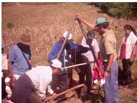
El nivel en "A" herramienta para obras de conservación de suelos y aguas.

Estado actual: Finalizada satisfactoriamente la FASE II, cuyo objetivo es reproducir las actividades desarrolladas en la primera fase con otros beneficiarios, dados los exitosos resultados obtenidos.