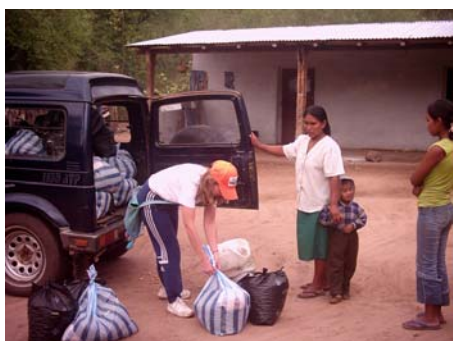
Entrega de semillas a beneficiarios

Se capacitan y promueven prácticas agropecuarias con enfoque agroecológico e intercambios de experiencias para generar nuevos conocimientos. Además se fortalece la organización indígena en su capacidad de gestión y liderazgo.