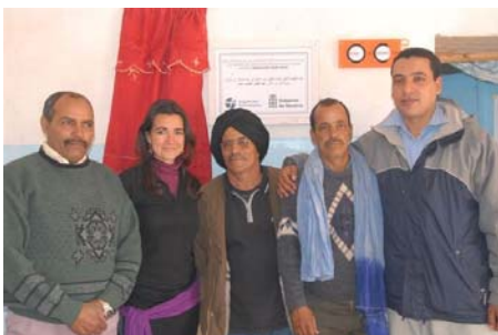
Equipo de la Oficina de Construcción