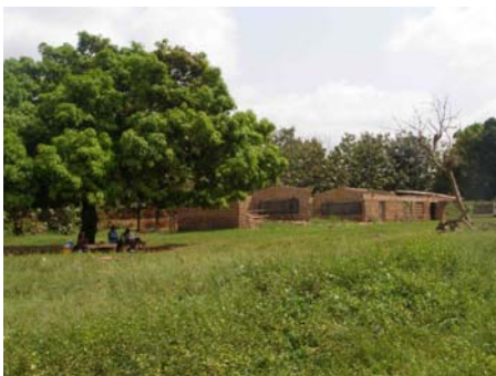
Estado actual escuela Knosia

Siendo éste el primer proyecto en común con la contraparte y conscientes todos de los tiempos necesarios para que el proyecto se implemente, tanto la Oficina de Educación del Distrito de Wenchi como ASF, creemos mejor comenzar con el proyecto de una sola escuela y, durante el transcurso de éste, desarrollar el proyecto global, concretando las siguientes comunidades dentro de una misma zona de actuación, tras comprobar el éxito de este primer proyecto.