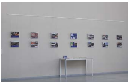
Exposición Aeropuerto Noain

Octubre: Construcción de Sede y módulo agropecuario para las comunidades de Timi y Tim. Bolivia.