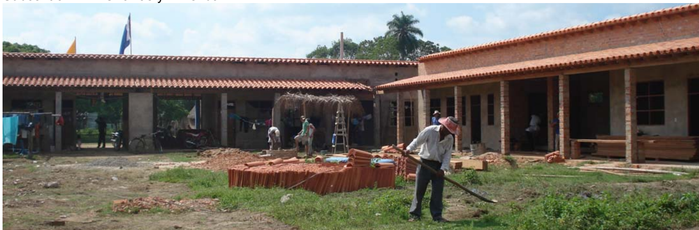
Subcentral Timi: Oficinas y Vivienda

A su vez, el proyecto contempla la edificación de galpon que sirva de implemento a las actividades económicas agroforestales, agropecuarias, etc., de las comunidades indígenas. Con ello, se conseguirá dotar a los dirigentes de las subcentrales con productos y otros recursos para su consumo y excedentes para el mercado.