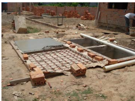
Cámara séptica común