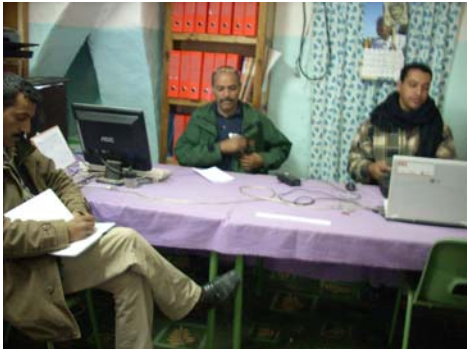
Técnicos de la Oficina Construcción