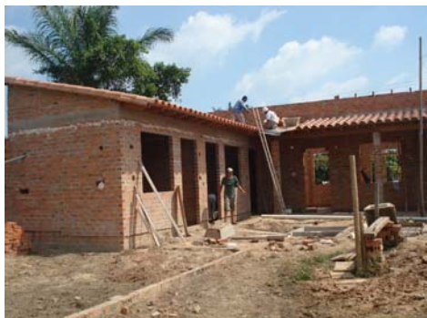
Aseos y oficinas comunes