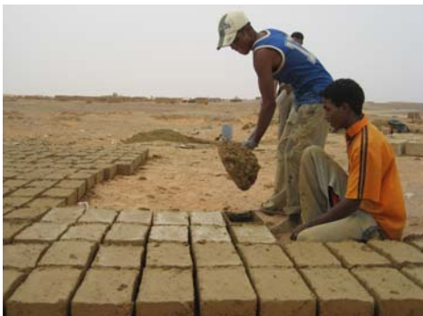
Elaboración bloques construcción