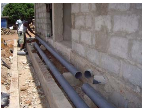
Conexiones a la fosa séptica