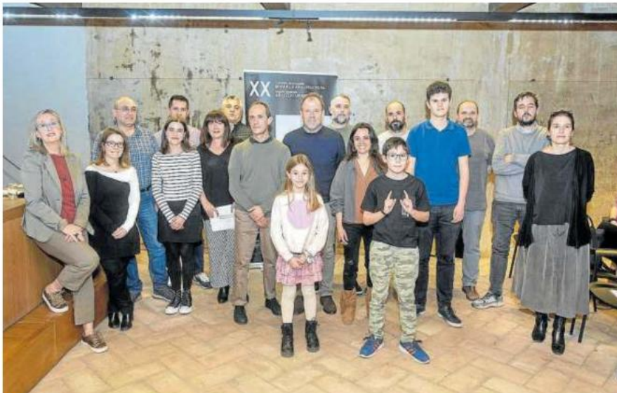
Foto de familia de las/os premiadas/os en el certamen de este año.

Por su parte, el encuentro Escuchar los paisajes de Carlos de Hita invitará a explorar a través de la narración sonora las múltiples formas de vida que componen los paisajes sonoros naturales. – Diario de Noticias