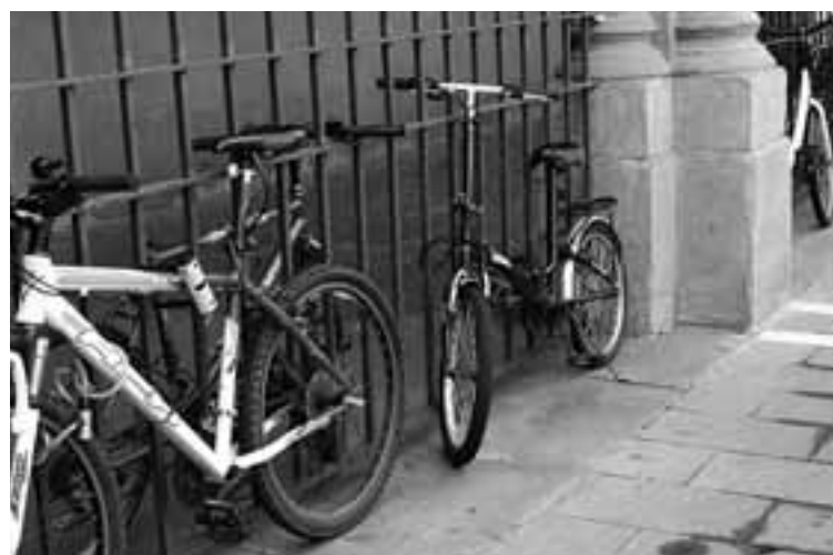
Bicicletas candadas a la verja de San Nicolás.

El vecino Enrique Ramírez envía una queja y adjunta una fotografía para ilustrarla. Dice que desde hace algún tiempo decenas de bicicletas aparecen candadas, día y noche a la verja de la parroquia de San Nicolás, en un