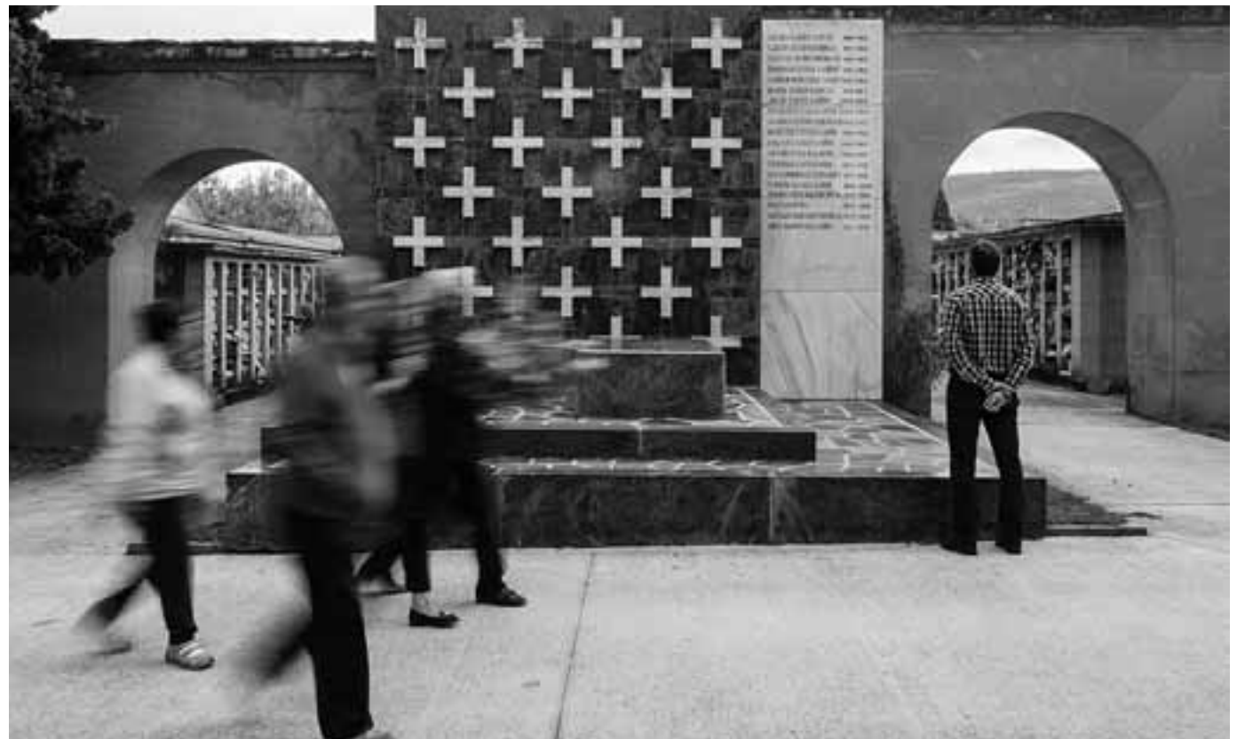
Mausoleo de Víctor Eusa en la calle San Gabriel del cementerio de Pamplona.